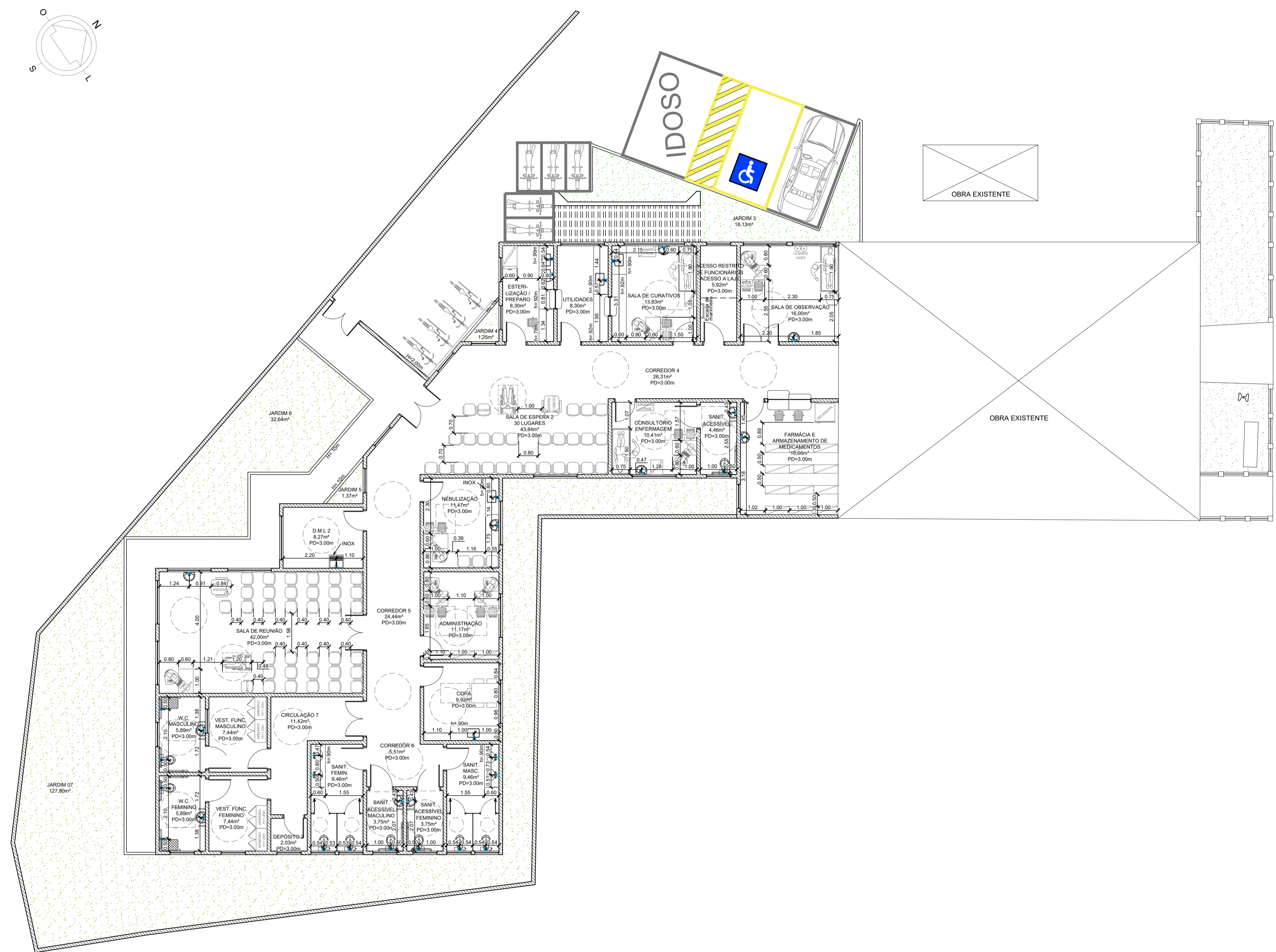
PLANTA DE LAYOUT - PAVIMENTO TÉRREO