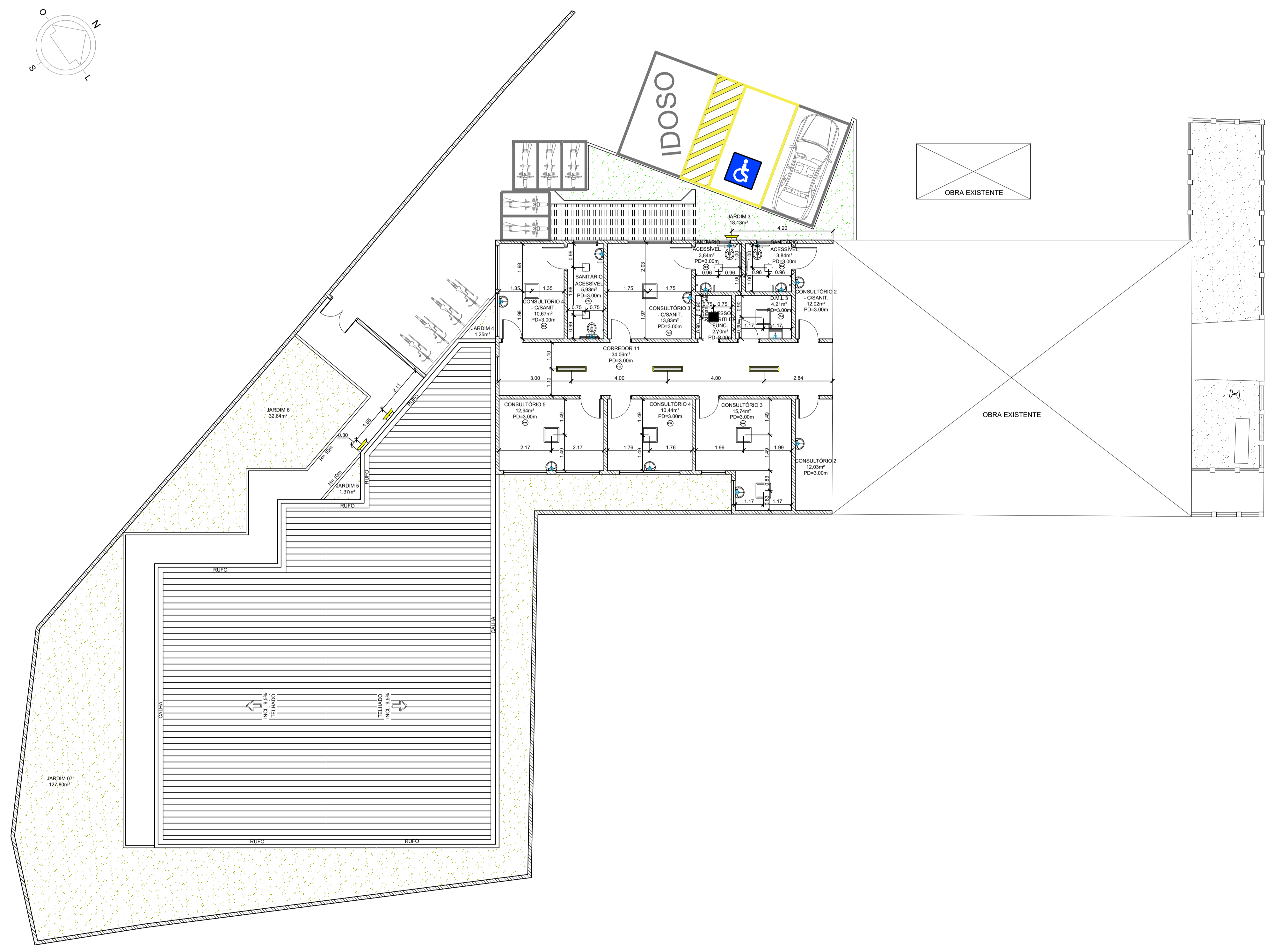
PLANTA DE FORRO / TETO - PAVIMENTO SUPERIOR